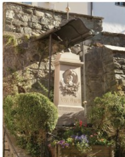
Abb. 1: Anton-Wallner-Denkmal, 2014, Foto Erwin Wieser

Zwei weitere Figurengruppen etwas außerhalb des Marktes an den jeweiligen Enden der Schmiedgrabenbrücke haben dasselbe Ereignis wie das Anton-Wallner-Denkmal als Ausgang, den Kampf um die Halbstundenbrücke. Eine Tafel am Sockel der rechten Figurengruppe klärt über den Hintergrund auf und gedenkt der 400 Pinzgauer, die hier einer napoleonischen Übermacht gegenüberstand. 1957/58 entstand dort ein frühes Werk des Salzburger Bildhauers Herbert Trapp für die Brückenköpfe mit einmal zwei und einmal drei muskulösen Männern, die aus dem Stein herauszuwachsen scheinen,