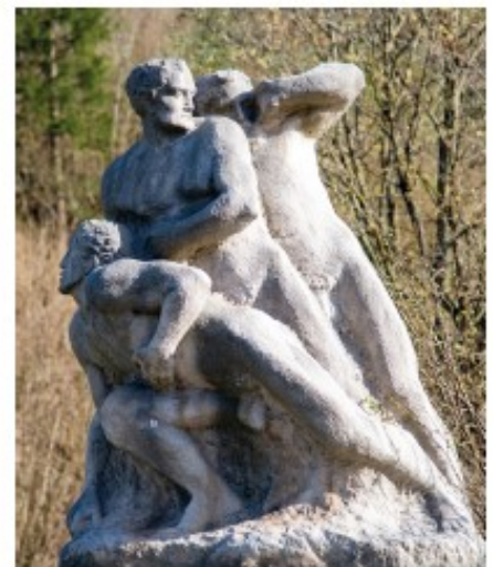
Abb. 2: Figurengruppe auf der Schmiedgrabenbrücke, 2023